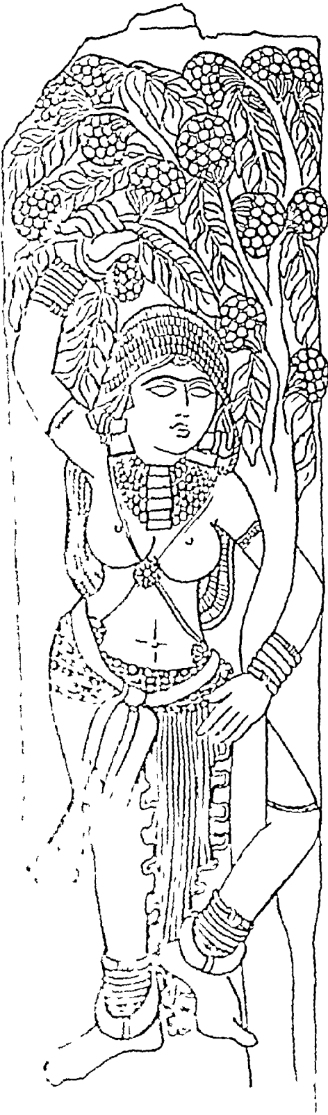
अशोक पुष्प मलय मथुरा के अशोक स्तूप के शिलालेख के आधार पर